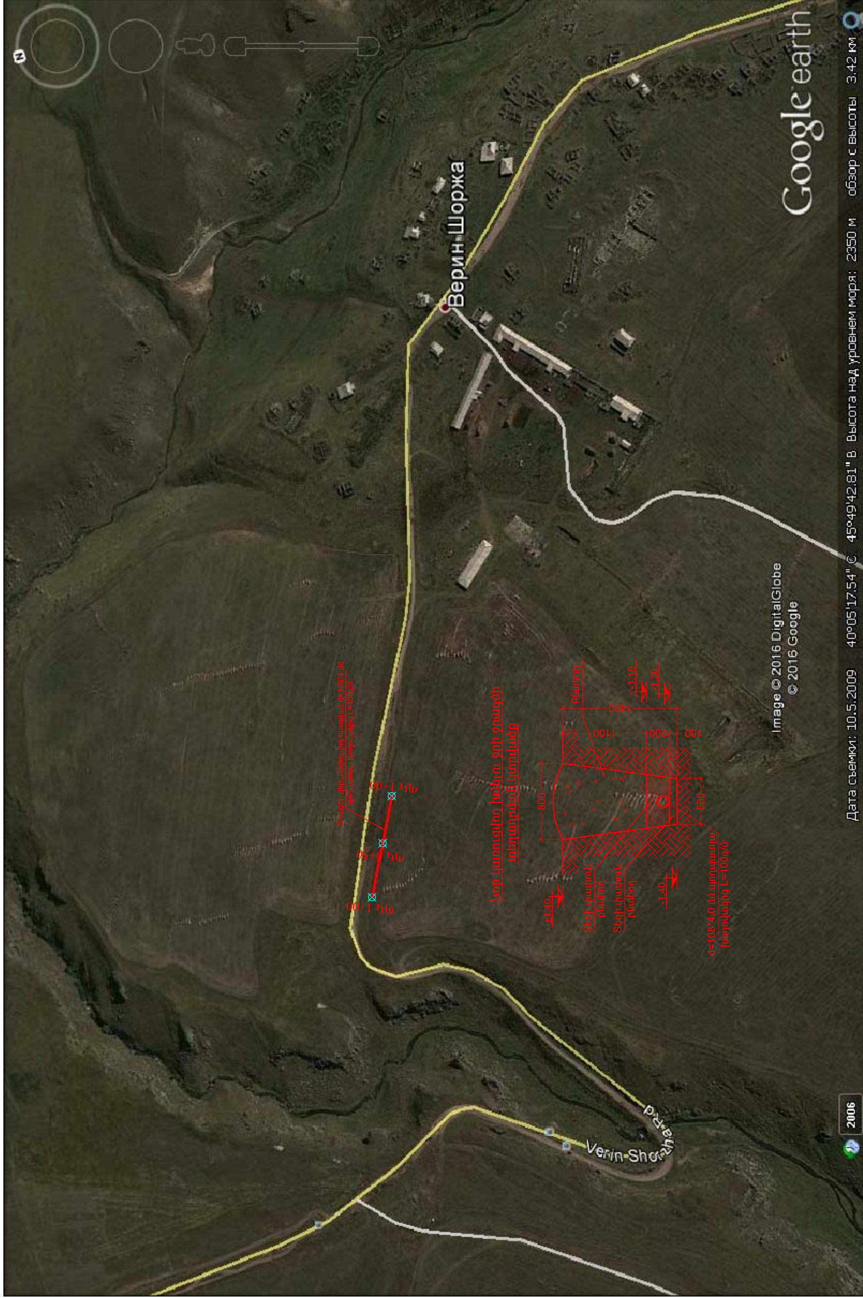
Дата съёмки: 10.5.2009 40°05'17.54" N 45°49'42.81" E Высота над уровнем моря: 2350 м обзор с высоты 3.42 км 2006